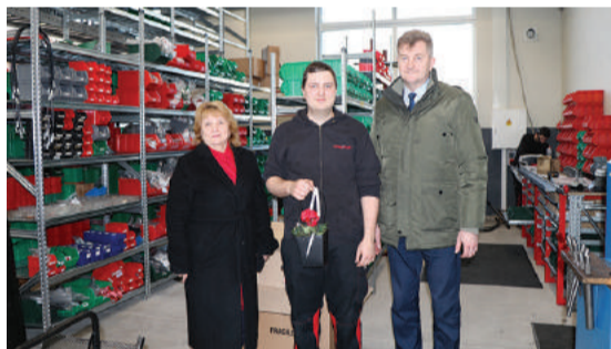
HANSA FLEX HIDRAULIKA Gulbenes nodaļa