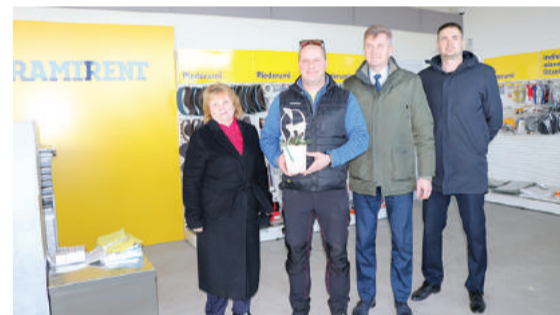
AS Ramirent Baltic Gulbene noma punkts