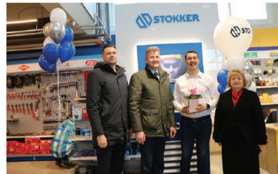
Stokker Agritech Gulbenes filiāle

Šā gada pavasarī Gulbenē, Brīvības ielā 77 durvis vēris jauns tirdzniecības kvartāls. Šobrīd tajā saimnieko AS Ramirent Baltic Gulbene noma punkts, Stokker Agritech Gulbenes filiāle, Wurth Gulbene un HANSA FLEX HIDRAULIKA Gulbenes nodaļa. Šiem uzņēmumiem pievienosies AS "AKVEDUKTS" Gulbenes klientu apkalpošanas centrs.