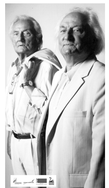
Foto: Dokumentālās filmas "Kokaru dziesmu svētki" pirmizrādes foto sesija.

Audio fragmentos: komponists, diriģents Jānis Rijnieks par Imantu un kora "Daile" dalībniece Zigrīda Grīna par Gido.