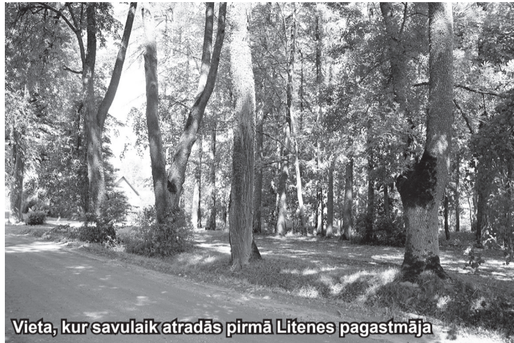
Vieta, kur savulaik atradās pirmā Litenes pagastmāja

Pirmā Litenes pagastmāja kopā ar skolu bija koku pudurī pie tagadējām "Arāju" mājām. Vēlāk daudzus gadus desmitus