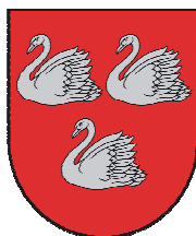
3.att. Gulbenes novada ģerbonis un karogs