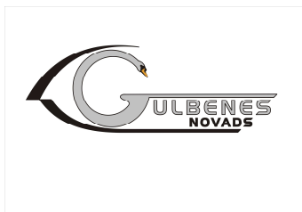
2.att. Gulbenes novada logo

Kopš 2009.gada 11.novembra novadam ir savs logo, kura autore ir Vineta Vaške (2.att.). 2010.gada 27.aprīlī Ģerboņu reģistrā reģistrēts novada ģerbonis - sarkanā laukā trīs (2/1) sudraba peldoši gulbji, Gulbenes novada karogs sastāv no divām krāsām vienādās daļās: sudrabortas un zaļas, karoga centrā atrodas novada ģerbonis (3.att.).