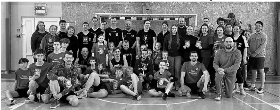
21. februārī Tirzas pamatskolā notika vēl nebijis pasākums – Draudzības kauss telpu futbolā un tautas bumbā.