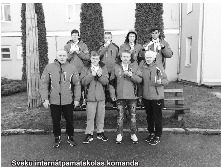
Sveķu internātpamatskolas komanda

Atgādinām, ka "Biļešu paradīzes" kasē Gulbenē, Ābeļu ielā 2, 101.kabinetā iespējams iegādāties biļetes uz dažādiem koncertiem, operas iestudējumiem, teātra izrādēm un citiem pasākumiem, kas notiek ne tikai Gulbenē, bet visā Latvijā. Biļetes uz izvēlētajiem pasākumiem var arī rezervēt, gan atnākot klātienē, gan arī zvanot pa tālruniem 26557582 vai 64497729. Kases darba laiki: no pirmdienas līdz ceturtdienai - no pulksten 8.00 līdz 18.00, piekdien - no pulksten 8.00 līdz 17.00.