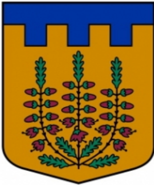
Lizuma pagasta ģerbonis