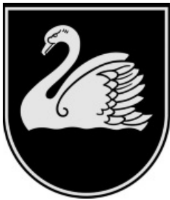
Gulbenes pilsētas ģerbonis

2015.gada 14.maijā ar valsts Heraldikas komisijas lēmumu Ģerboņu svētku laikā svinīgā ceremonijā Lejasciema pagasts saņēma atjaunoto ģerboni, kas tika ieviests 1938.gadā, bet atcelts 1939.gadā, kad Lejasciems zaudēja pilsētas tiesības.