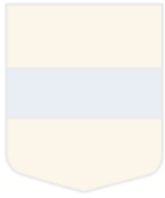
Lejasciema pagasta ģerbonis

Zelta laukā zila sija, horizontālā zilā joslā simbolizē Gauju, bet apkārt pamatne - zelta laukus upes krastos.