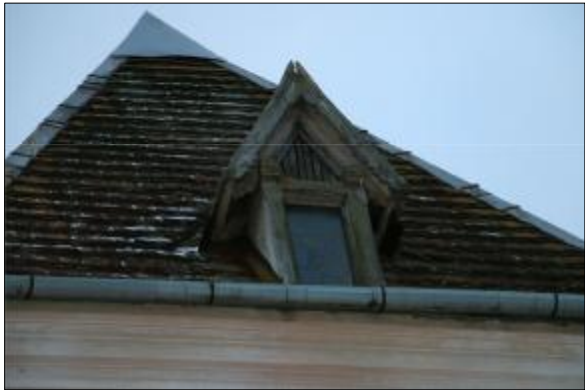
Drūpošās dzegas stūra nostiprināšana