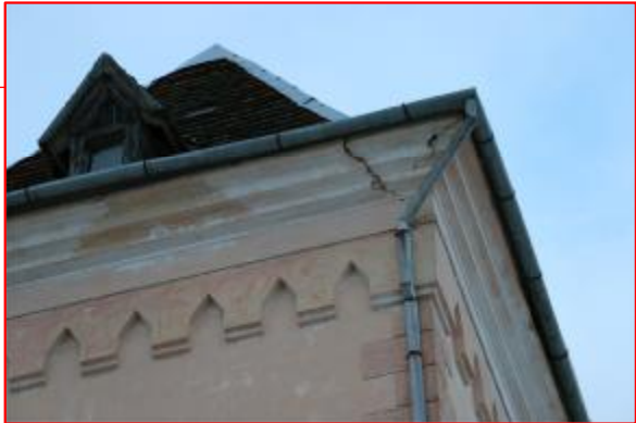
Dzegas mezgla atjaunošana. Nokalt dzegas apmetumu ap plaisas vietām, lai konstatētu, vai plaisas iet pa mūra šuves vietu vai arī pa ķieģeļiem. Ja plaisa iet pa mūra šuves vietu, nepieciešam mūra injecēšana, ja pakieģeļiem, dzega jāpārmūrē.